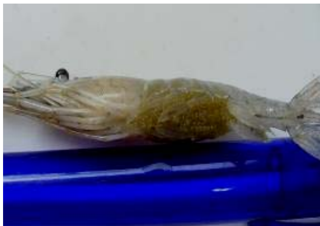
شکل ۴- ماده تخم‌دار (مقیاس: خودکار)

تخم: در ماده‌های تخم‌دار، تخم‌ها به رنگ سبز (شکل ۴) و