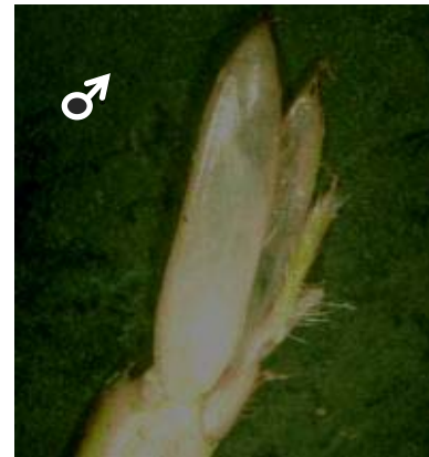
شکل ۳- ضمایم جنسی واقع در دومین جفت پای شکمی (عکس از نگارنده، تهیه شده از استریومیکروسکوپ)