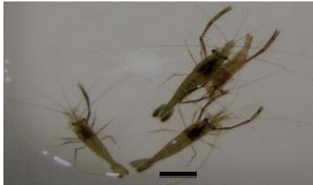
شکل ۲- Macrobrachium nipponense (مقیاس: ۲۰ میلی متر)