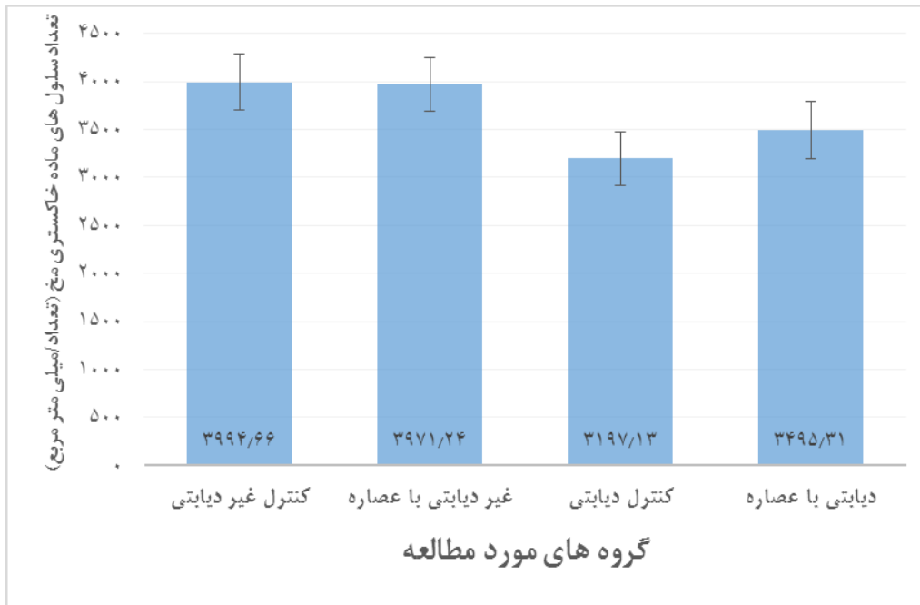
نمودار ۲- مقایسه میانگین \pm انحراف معیار تعداد سلول های ماده خاکستری منخ در نوزادان ۱۴ روزه در چهار گروه مورد مطالعه