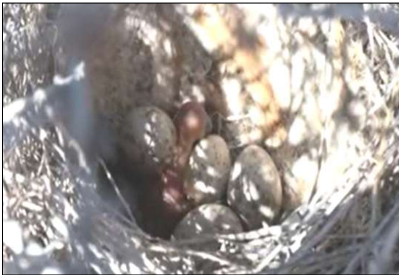
شکل ۳- تخم، جوجه و لانه زاغ بور

عوامل انسانی از قبیل بیابان‌زایی از جمله عواملی هستند که به طور غیرمستقیم بر زیستگاه زاغ بور تأثیر می‌گذارند. این