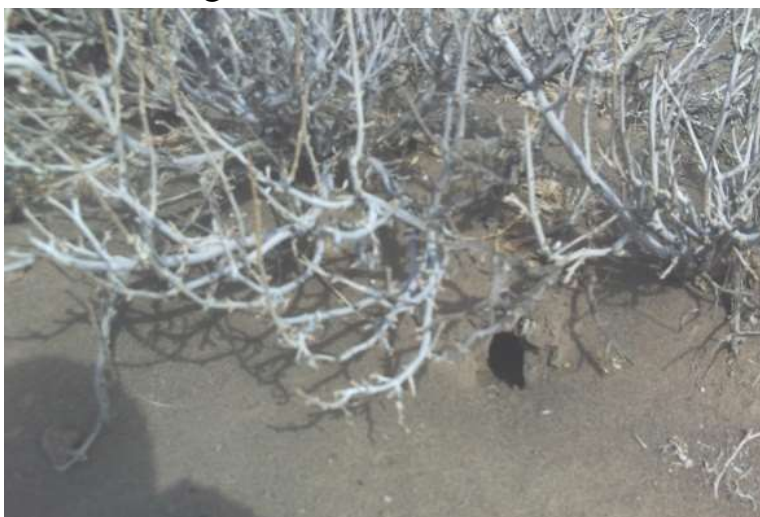
شکل ۵- لانه جوندگان در پناهگاه حیات وحش دشت لاغری