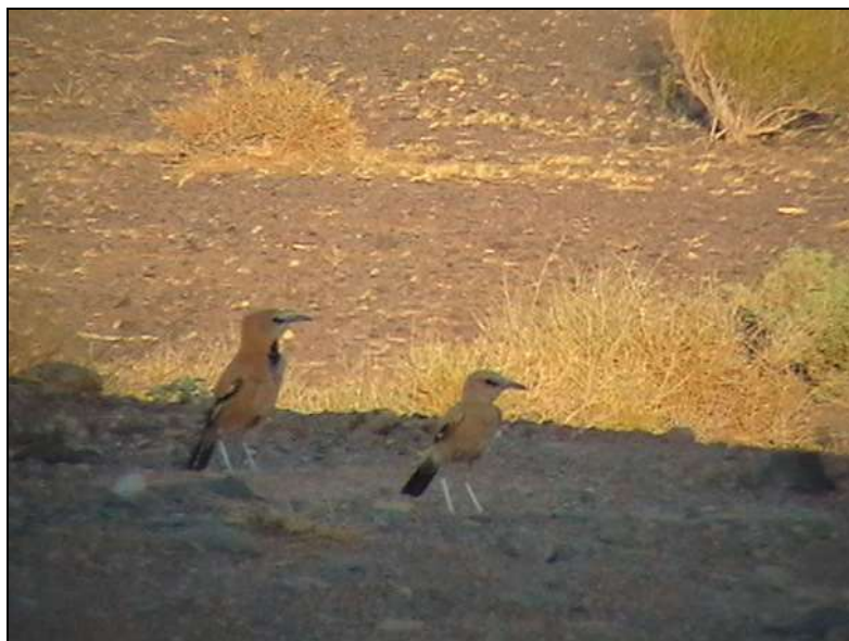
شکل ۲- زاغ بور بالغ و نابالغ در پناهگاه حیات وحش دشت لاغری