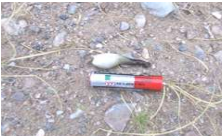
شکل ۴- کیسه حاوی فضولات جوجه‌های زاغ بور